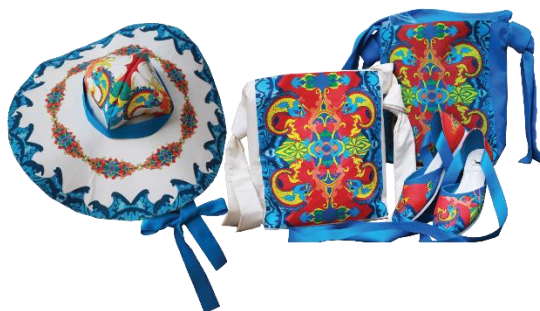
Figure 4 Product

จากตารางที่ 8 ผลประเมินความพึงพอใจของกลุ่มตัวอย่างที่มีต่อการออกแบบผลิตภัณฑ์ประกอบเครื่องแต่งกายโดยใช้อัตลักษณ์จากเรือกอและ โดยรวมพบว่ากลุ่มตัวอย่างมีความพึงพอใจผลิตภัณฑ์ด้านการใช้งานมากโดยมีค่า \bar{X}=3.95 โดยแยกเป็นการใช้งานง่าย \bar{X}=4.13 ขนาดสัดส่วนของผลิตภัณฑ์ที่มีความสอดคล้องกับการใช้งาน \bar{X}=3.77 ด้านความสวยงามพบว่ามีความพึงพอใจผลิตภัณฑ์มากโดยมีค่า \bar{X}=4.17 โดยแยกเป็นความเหมาะสมของโครงสร้างผลิตภัณฑ์ \bar{X}=4.10 ผลิตภัณฑ์และลวดลายมีสีสันชัดเจนสวยงาม \bar{X}=4.23 ด้านความคิดสร้างสรรค์และอัตลักษณ์พบว่ามีความพึงพอใจผลิตภัณฑ์มากโดยมีค่า \bar{X}=4.19 โดยแยกมีการตัดทอนลวดลายได้อย่างเหมาะสม \bar{X}=4.07 ผลิตภัณฑ์บ่งบอกถึงอัตลักษณ์ของเรือกอและ \bar{X}=4.30