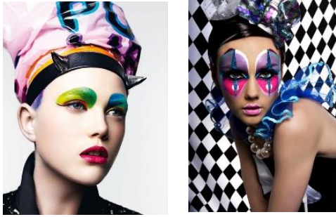
ภาพที่ 6 ภาพอ้างอิงการแต่งหน้าแบบแฟนตาซี