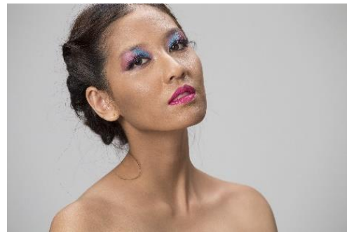
ภาพที่ 12 ภาพแนวการแต่งหน้าแบบแฟนตาซี (Fantasy) นางแบบผิวดำหรือคล้ำ

น้ำตาลอ่อน น้ำตาลแดง ส้มน้ำตาล สีแดงอมเทา คือให้มีโทนสีร้อนแต่ผสมสีเทาหรือดำเข้าไปให้กลมกลืนบ้างจะทำให้เหมาะกับสีผิวมากขึ้น แต่ในการศึกษาครั้งที่ทางผู้จัดทำพบปัญหาคือไม่สามารถจัดหานางแบบผิวดำหรือคล้ำมาได้ ทางผู้จัดทำจึงแก้ปัญหาด้วยวิธีคือ ใช้นางแบบผิวสีแทนหรือผิวสีน้ำผึ้งมาลงรองพื้นสีเข้ม เพื่อให้มีสีผิวสีเข้มขึ้นกว่าปกติ และเมื่อถ่ายภาพออกมาสีของรองพื้นที่ลงไปไม่ให้ผลที่เหมือนกับนางแบบผิวดำหรือคล้ำสีของรองพื้นไม่มีความเข้มที่เหมือนกับสีผิวจริง [5]