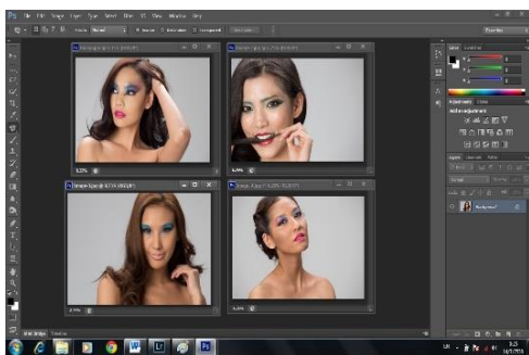
ภาพที่ 8 ภาพขั้นตอนการวาง Layout